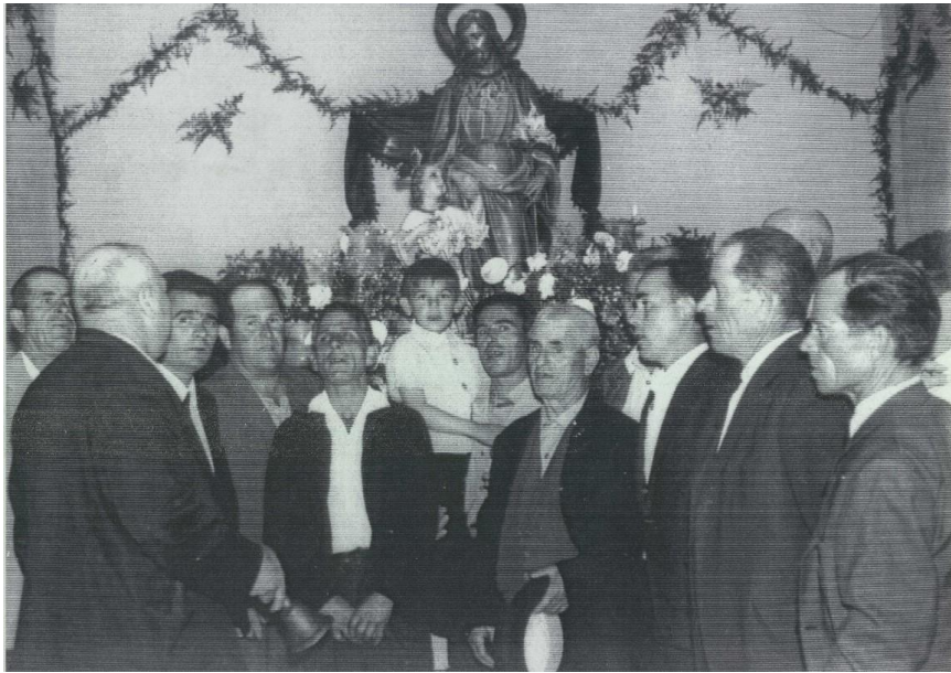
Auroros de Santa Cruz (Murcia) en el pasado.