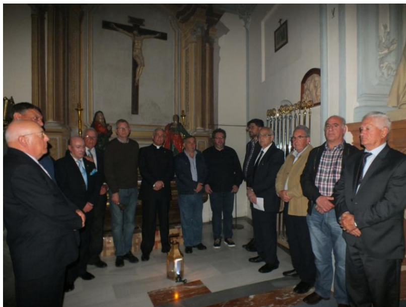
Auroros de Santa Cruz (Murcia) en la actualidad.