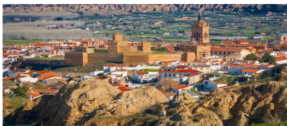
Alcazaba y catedral de Guadix

VIAJE GEOARQUEOLÓGICO, HISTÓRICO-CULTURAL Y GASTRONÓMICO AL PARQUE MEGALÍTICO DE GORAFE Y LA CIUDAD MONUMENTAL DE GUADIX (GRANADA), LA CIUDAD DE ALMERÍA, SU ALCAZABA Y OTROS MONUMENTOS, ASÍ COMO EL YACIMIENTO ARQUEOLÓGICO DE LOS MILLARES, EL MÁS IMPORTANTE DE LA EDAD DEL COBRE EN EUROPA, CON MÁS DE 5.000 AÑOS DE ANTIGÜEDAD - CON GUÍAS OFICIALES Y LOS MEJORES SERVICIOS.