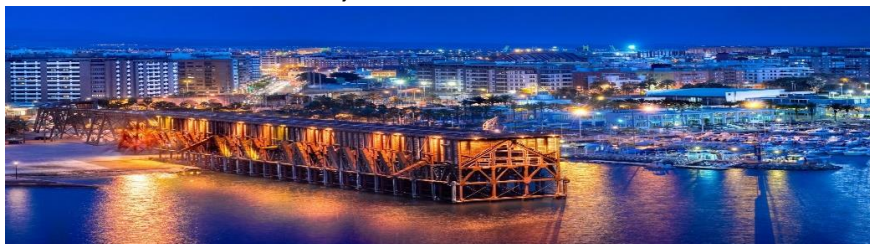
Ciudad y puerto de Almería

CUENTA DE LA ASOCIACION RAFALEÑA PARA LA CULTURA Y LA AMISTAD (ARCA), EN LA CAJA RURAL CENTRAL DE RAFAL, NÚMERO: ES34 3005 0020 94 2527102723