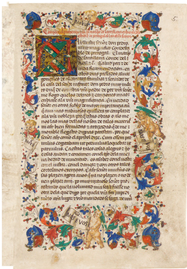
Maestro del Cancionero (iluminador) Íñigo López de Mendoza, marqués de Santillana, Cancionero , h. 1456 Salamanca, Universidad de Salamanca. Biblioteca General Histórica

Avanzaban por toda Europa ideas nuevas que, en el curso del siglo xv, iban a transformar radicalmente la historia del continente, desafiando el orden medieval y abriendo así paso al Estado moderno y al humanismo. En este contexto, a caballo entre la Edad Media y el Renacimiento, este poderoso y culto noble castellano tuvo a su servicio miniaturistas y encuadernadores, encargó numerosas traducciones de autores clásicos y atesoró una magnífica biblioteca, con ejemplares traídos de Italia que servirán de base a sus propios escritos. Los libros de lujo, además de satisfacer una pasión bibliófila egoísta y solitaria, también fueron objetos sociales que otorgaban fama y prestigio a sus propietarios. Consciente de estos valores, el marqués de Santillana recurrió a agentes y redes de intercambio que le permitieron entrar en contacto con algunos de los grandes centros de producción de manuscritos iluminados, y así emular y competir con otros distinguidos bibliófilos coetáneos. De este modo, ratificó su liderazgo cultural y estético entre la nobleza castellana del siglo xv.