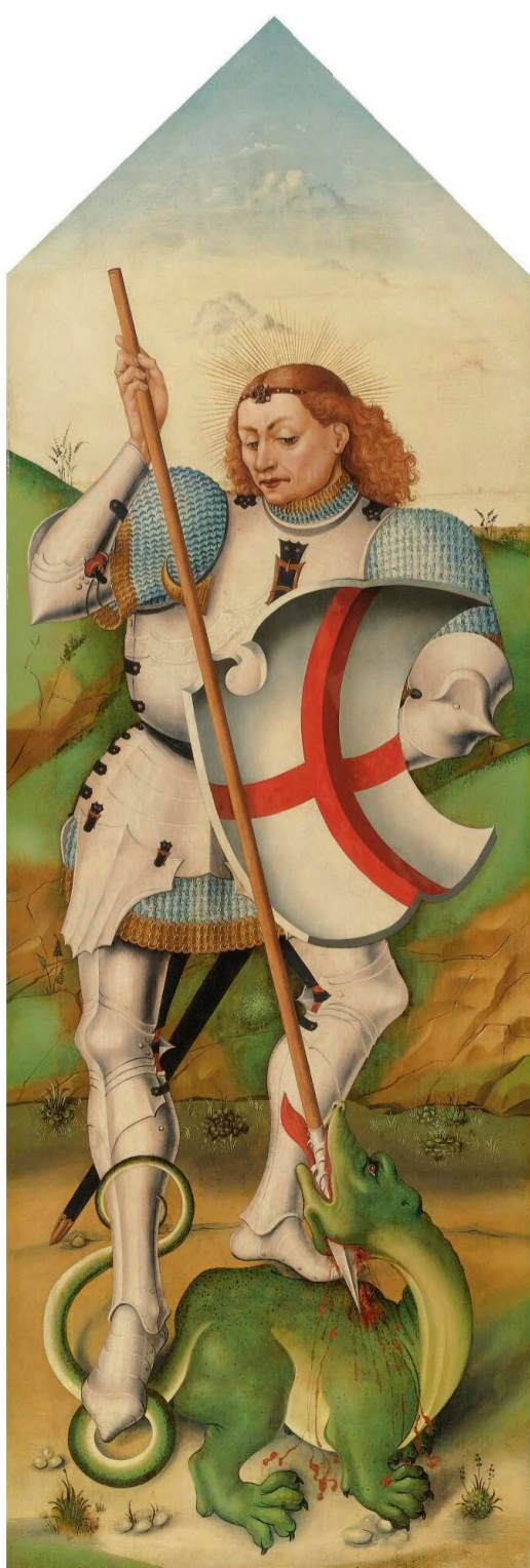
Jorge Inglés San Jorge y el dragón , doc. 1455 Nueva York, The Leiden Collection