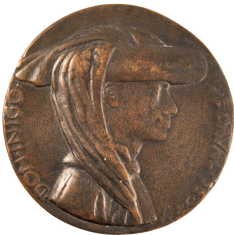
Pisanello Medalla de Íñigo Dávalos, 1449 Madrid, Museo Arqueológico Nacional

Tras la batalla de Olmedo, la posesión por parte de los Mendoza de Manzanares El Real tendría importantes consecuencias en la villa, entre ellas la construcción del castillo más emblemático y mejor conservado de la región madrileña. Las obras fueron comenzadas por el hijo del marqués, Diego Hurtado de Mendoza, I duque del Infantado, y serían concluidas por su nieto homónimo, Íñigo López de Mendoza, quien contrató al arquitecto Juan Guas, uno de los máximos representantes del gótico tardío en Castilla y arquitecto de los Reyes Católicos.