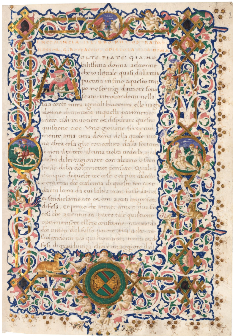
Miniaturista del marqués de Santillana (iluminador) Giovanni Boccaccio, Filostrato , h. 1455-58 Madrid, Biblioteca Nacional de España

En Buitrago, la villa medieval más pujante del norte de la sierra, el marqués de Santillana impulsó la reforma del castillo de su linaje, que transformó casi por completo en sus elementos defensivos, dándole al mismo tiempo un carácter palatino acorde con los usos de las residencias nobiliarias del siglo xv. No contento con esto, pocos años antes de morir fundó en la localidad el hospital de San Salvador. De su desaparecida iglesia proceden el Retablo de los Gozos de santa María y la espléndida tabla con san Jorge matando al dragón, que, tras más de un siglo en el extranjero, vuelve a Madrid con motivo de esta exposición. También decoraba el templo hospitalario un espléndido alfarje mudéjar que cubría la capilla mayor, y que hoy preside el presbiterio de la iglesia parroquial de Santa María del Castillo.